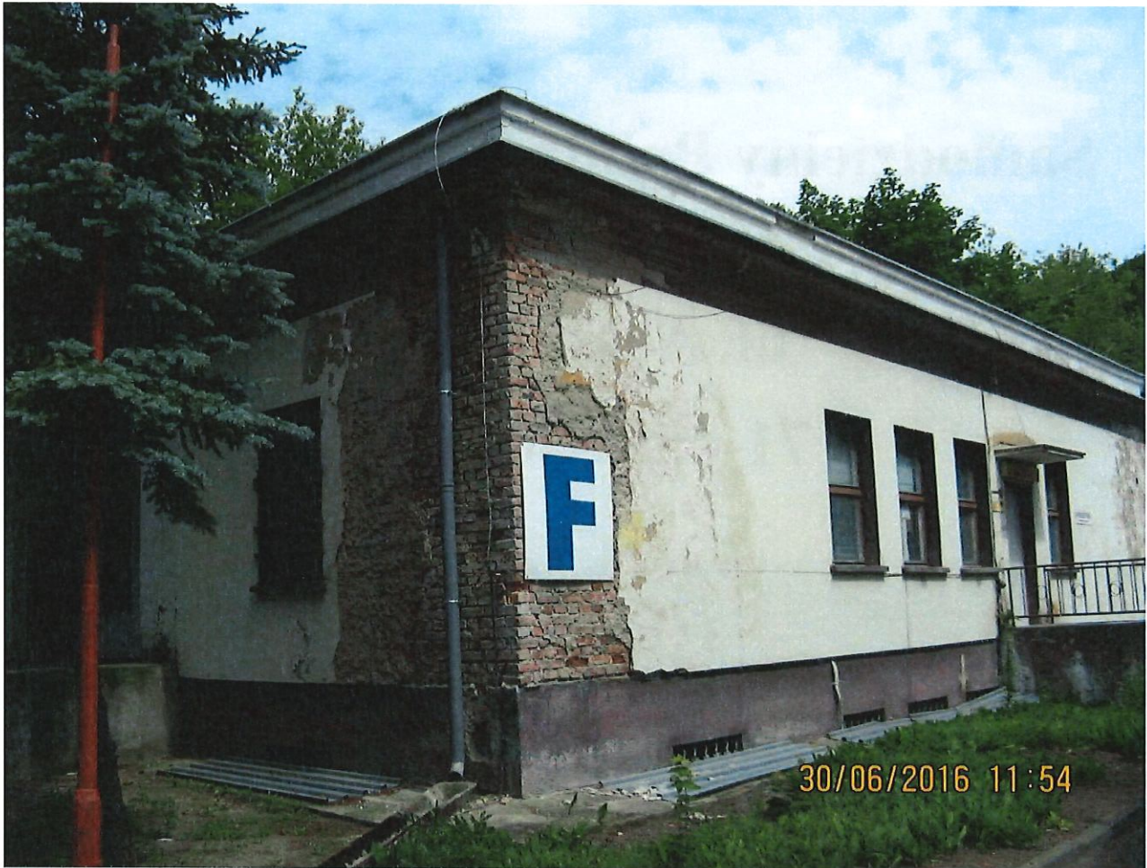
Budynek „F” – dawny Zakład Patomorfologii.